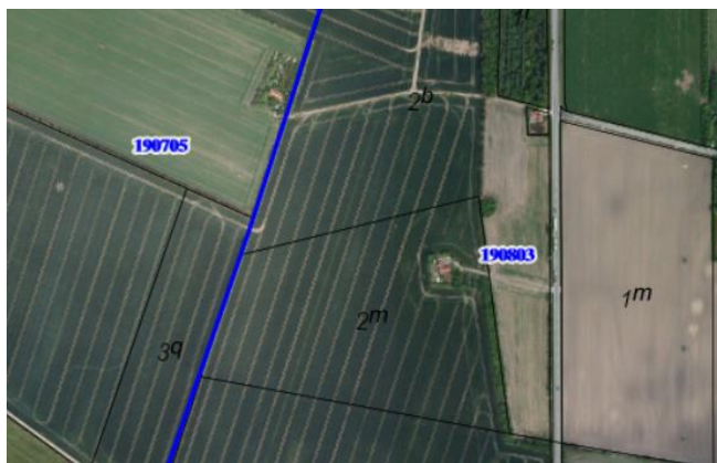
Orto Foto 2008

Det har fungeret som markskel og er sammenfaldende med den nuværende matrikelgrænse. Mellem 2 m og 2b Gunderup By Horne. Det er vanskeligt med sikkerhed at fastslå et gammelt diges formål, men her kunne det se ud som om, at diget har afgrænset en lille ejendoms nordlige grænse. Det er interessant at se hvordan vejen ind til ejendommen snor sig omkring Bredhøj. Denne ejendom findes ifølge ortofoto stadig, men adgangsvejen er nu direkte til Ringkøbingvej.