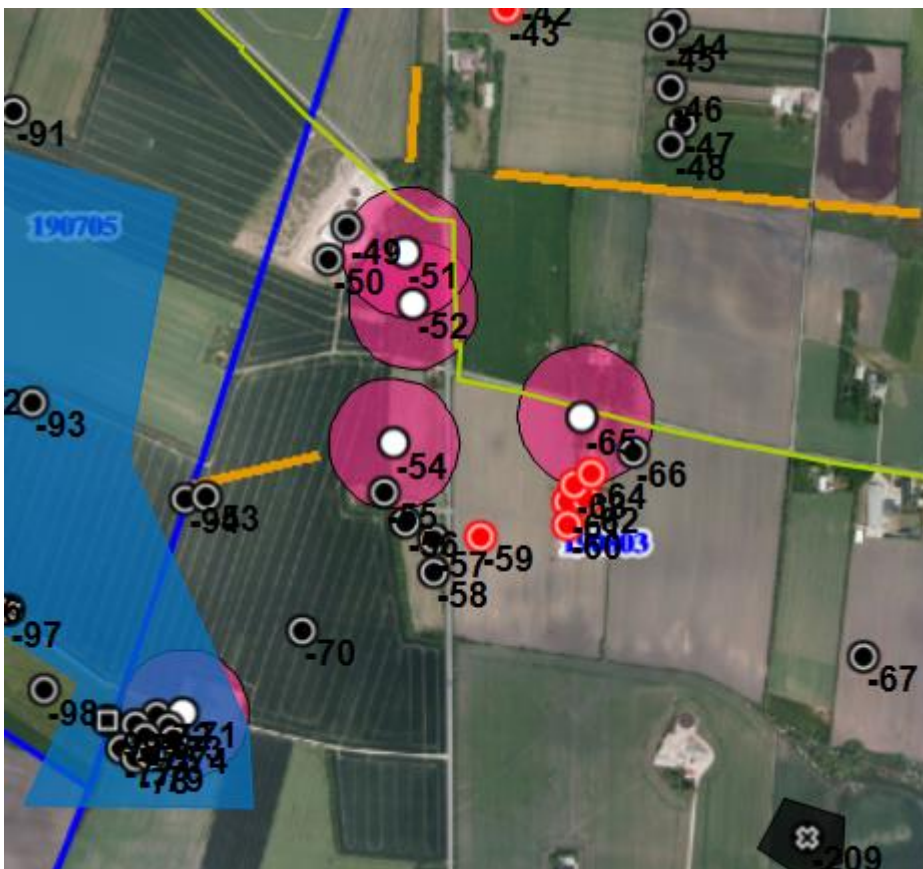
Fund og fortidsminder – med lyserødt 100 m zoner om fredede gravhøje.

I forbindelse med en evt. reetablering af diget skal der også gøres opmærksom på de mange overpløjede gravhøje i området. Der må ikke graves dybere end pløjelaget og muldjord skal skubbes sammen med største forsigtighed.